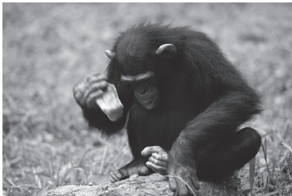
Rysunek 1.2 Szympans zwyczajny ( Pan troglodytes ) w Gabonie używający narzędzi do rozłupania orzechów

które uwalnia ciepło w procesie spalania. Czynniki aktywujące dostawy energii zależą od przepływu informacji oraz od ogromnej liczby urządzeń, od tak prostych narzędzi jak tłuki kamienne i dźwignie po skomplikowane silniki spalające paliwo i reaktory uwalniające energię wytworzoną w reakcji rozszczepienia jądrowego. Ewolucyjna i historyczna kolejność wydarzeń, jakie przyczyniły się do postępów dokonanych przez ludzkość, jest łatwa do nakreślenia w szerokich kategoriach jakościowych. Podobnie jak w przypadku organizmów nieprzeprowadzających fotosyntezy, najbardziej fundamentalnym zapotrzebowaniem człowieka na energię jest potrzeba pożywienia. Poszukiwanie i zbieranie jedzenia przez hominidów bardzo przypominało praktyki zdobywania pożywienia stosowane przez ich przodków, ssaki naczelne. I chociaż niektóre naczelne — a także kilka innych ssaków (w tym wydry i słonie), pewne gatunki ptaków (kruki i papugi), a nawet niektóre bezkręgowce (głównonogi) — wykształciły niewielki zakres podstawowych umiejętności stosowania narzędzi [Hansell 2005; Sanz, Call, Boesch 2014; rysunek 1.2], tylko hominidni doprowadzili tę umiejętność do takiego poziomu, że używanie narzędzi stało się ich cechą wyróżniającą.